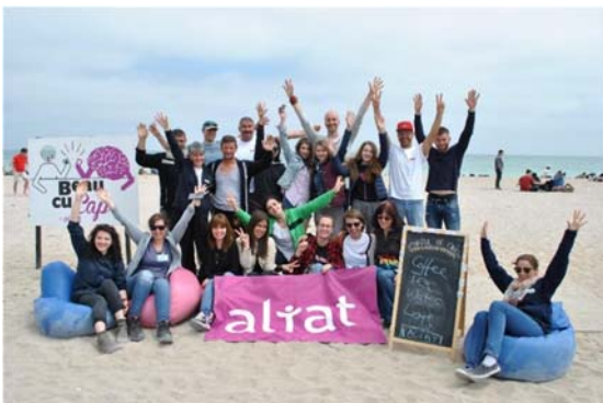
#Cortuldechill - 27 april - 2 may 2018

Ne place să credem că este pentru că am făcut o treabă bună în Vama Veche în ultimii 4 ani.